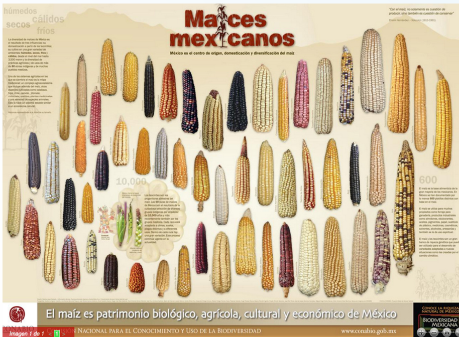
Figura 1. Variedades de maíces criollos encontrados en México (Recuperado de CONABIO).

Key words: Creole/Native maize, genetic diversity, biocultural heritage.