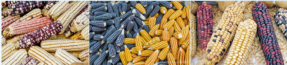
Figura 5 Diversidad en la pigmentación de maíces nativos/criollos

amplio aporte nutricional (Bello-Pérez et al., 2015). En este sentido el contenido de compuestos fenólicos presentes en maíces criollos se ha vinculado a disminuir fuertemente el estrés oxidativo que se ha asociado a enfermedades crónico-degenerativas como cáncer, enfermedad de Alzheimer y enfermedad de Parkinson (Feregrino-Pérez et al., 2024). Mientras que en las variedades de maíz blanco la abundancia de compuestos fenólicos y antocianinas es baja, el consumo del maíz azul se ha asociado con efectos benéficos para la salud humana, al promover el bienestar intestinal (Reynoso-Camacho et al., 2015; Astorga-Gaxiola et al., 2021). Por otra parte, el maíz criollo/nativo es fuente importante de proteínas, que, además, contiene diversos péptidos (pequeñas moléculas formadas de aminoácidos) cuyas funciones pueden promover la defensa ante patógenos (Feregrino-Pérez et al., 2024).