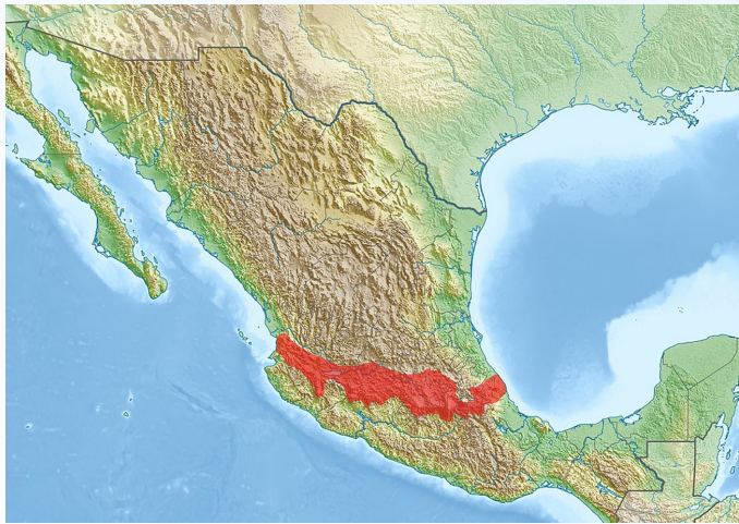
Figura 2 | Eje neovolcánico de México. Región de domesticación del maíz. (Adaptado de Wikipedia).